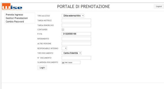
Pagina video di prenotazione